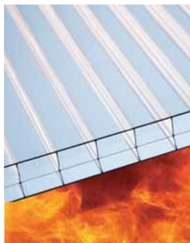
Makrolon® multi UV FR