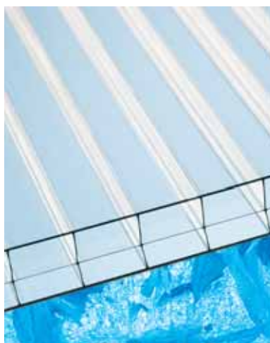
Makrolon® multi UV HR